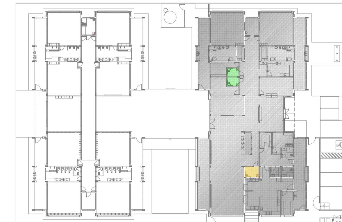
CROQUI DE REFERÊNCIA